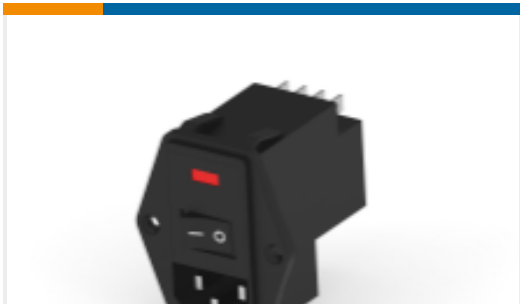
TE 产品编号6609104-4 PE0S0SS60=C1129