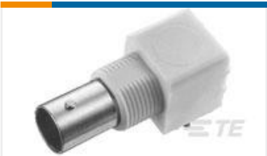
TE 产品编号5415105-2 JACK,R/A,75 OHM,BNC PCB