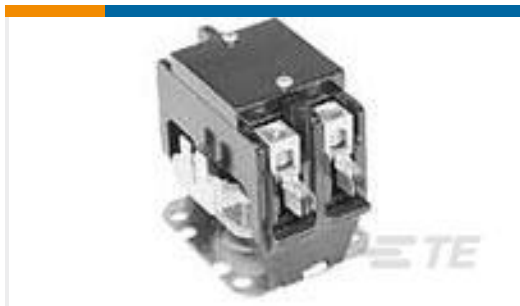
TE 产品编号2-1611004-4 3100-20T18999CL=40A 2P 120V PR