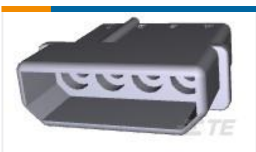
TE 产品编号1-480426-0 04P CMNL CAP HSG F/H NATL