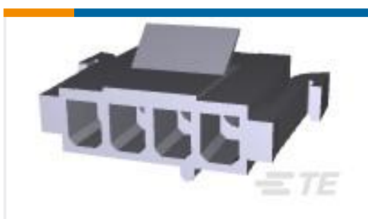
TE 产品编号1-480425-0 04P CMNL PLUG HSG P/M NATL