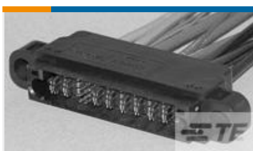
TE 产品编号 1600236-6 PAN MT PLUG, MBXL, 2P+24S+2P