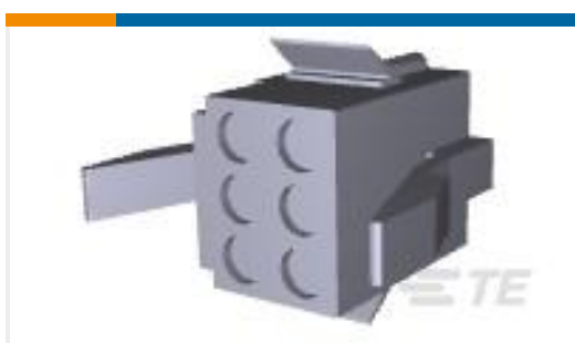
TE 产品编号1-171196-0 6 POS MATE-N-LOK S