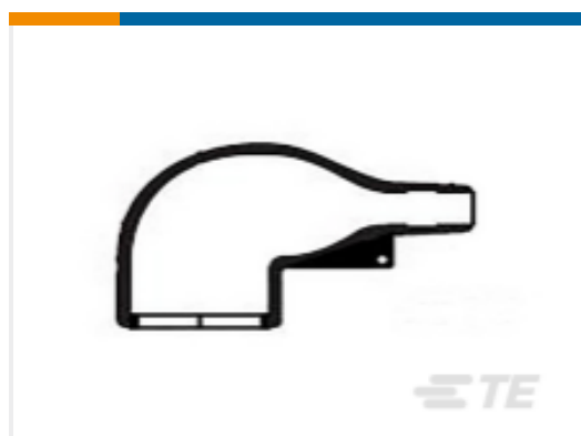
TE 产品编号EF9981-000 222K121-25L/225-0