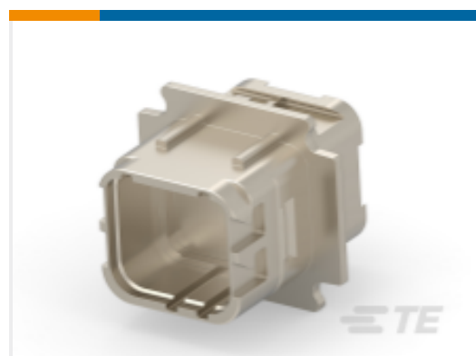
TE 产品编号ZPF000000000146309 Rectangular Connector Receptacle Extenders, Tool-less Assembly