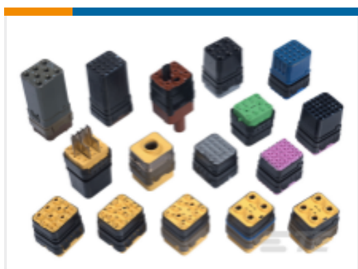
TE 产品编号ZPF000000000148762 DMC-M 99-04 AN (=33537-P0000)