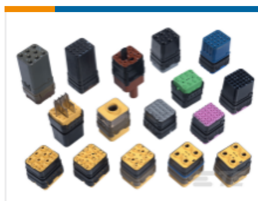
TE 产品编号ZPF000000000148762 DMC-M 99-04 AN (=33537-P0000)