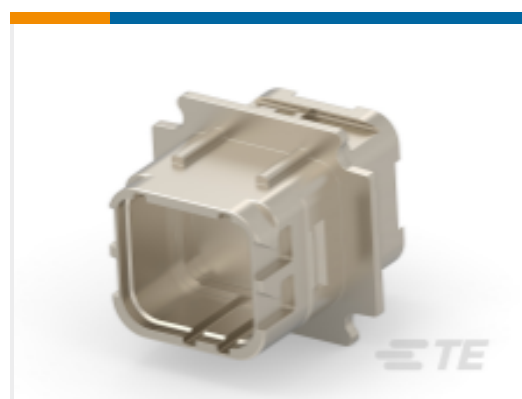
TE 产品编号ZPF000000000146309 Rectangular Connector Receptacle Extenders, Tool-less Assembly