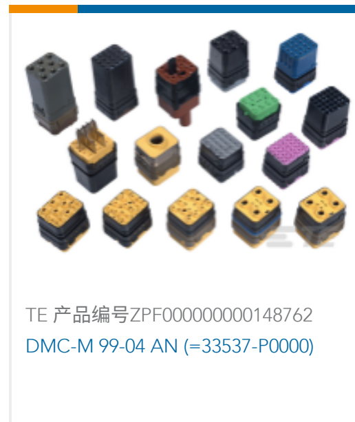
TE 产品编号ZPF000000000148762 DMC-M 99-04 AN (=33537-P0000)