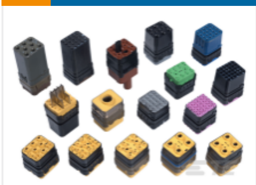
TE 产品编号ZPF000000000148762 DMC-M 99-04 AN (=33537-P0000)