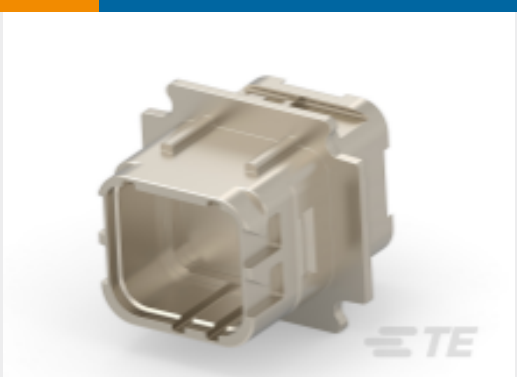
TE 产品编号ZPF000000000146309 Rectangular Connector Receptacle Extenders, Tool-less Assembly