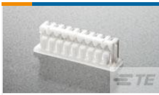
TE 产品编号1-440146-5 1.25mm WTB Socket,Housing, 15p