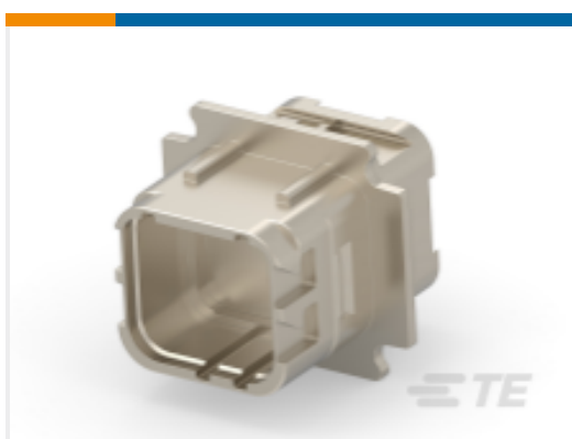
TE 产品编号ZPF000000000146309 Rectangular Connector Receptacle Extenders, Tool-less Assembly