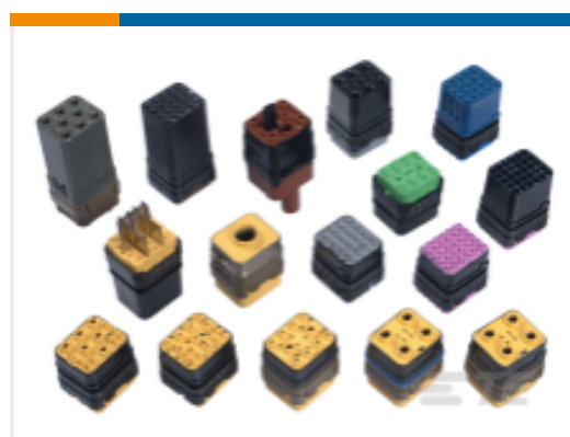
TE 产品编号ZPF000000000148762 DMC-M 99-04 AN (=33537-P0000)