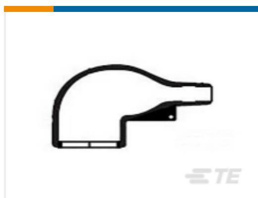
TE 产品编号EF9981-000 222K121-25L/225-0