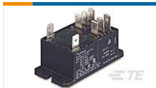
TE 产品编号5-1393211-4 T92P11D22-24