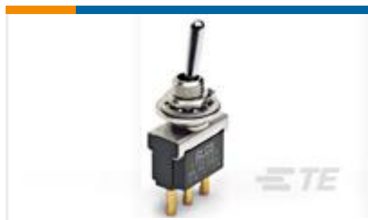
TE 产品编号 3-6437630-5 F4TN0904=MINIATURE TOGGLE