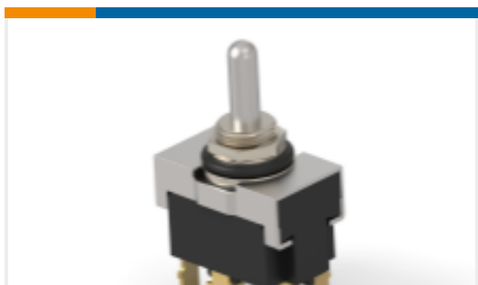
TE 产品编号 7-6437630-2 AWTN1504 = POWER TOGGLE