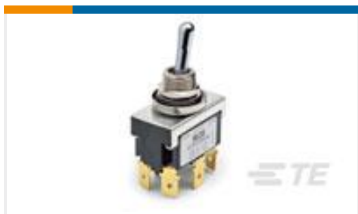
TE 产品编号 7-6437630-0 AWTD1504 = POWER TOGGLE