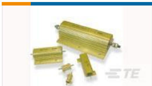
TE 产品编号5-1625984-2 HSA50 390R 5%