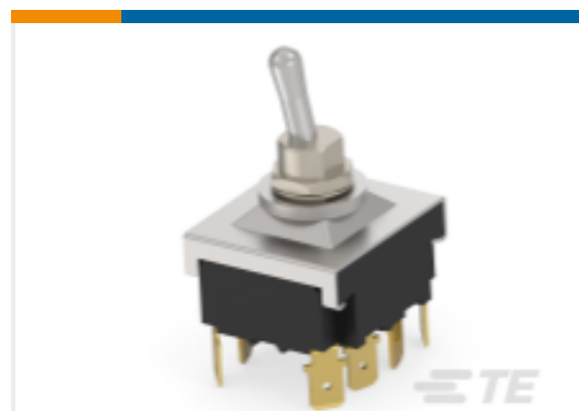
TE 产品编号 8-6437630-0 A4TK15W04