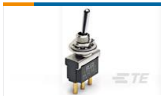
TE 产品编号 2-6437630-0 FTD0904=MINIATURE TOGGLE