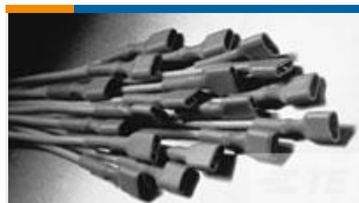
TE 产品编号5426974001 LSTT-25.4-0-SP