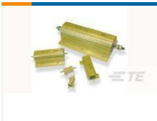
TE 产品编号1-1630019-4 HSC200 2K4 5%