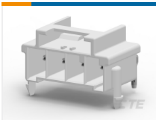
TE 产品编号1-1969694-4 PTL 1X4 PCB HEADER R/A HITEMP KEY A LGR