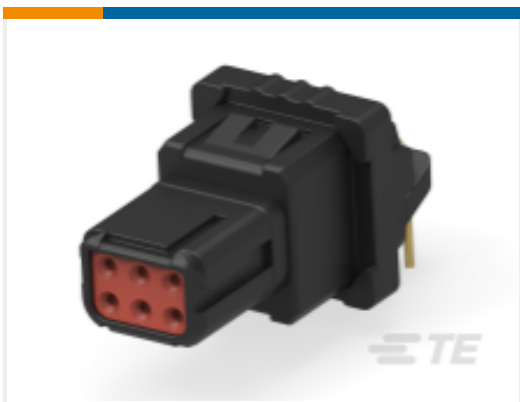
TE 产品编号YD369-B99-AP400000 Rectangular Connectors: 9-Way Panel Mount, 90PCB