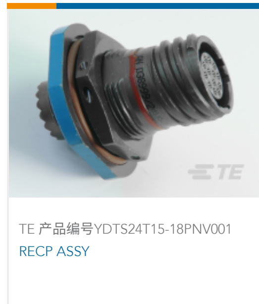
TE 产品编号YDTS24T15-18PNV001 RECP ASSY