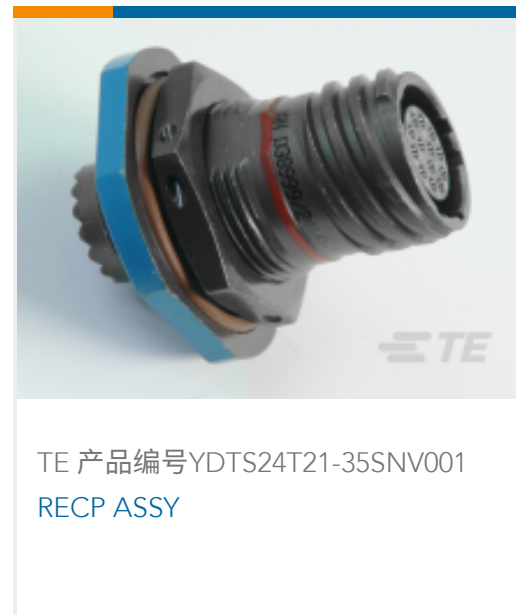
TE 产品编号YDTS24T21-35SNV001 RECP ASSY