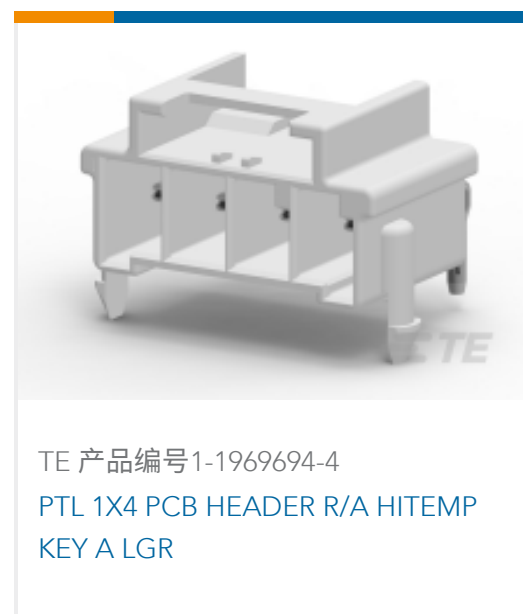
TE 产品编号1-1969694-4 PTL 1X4 PCB HEADER R/A HITEMP KEY A LGR