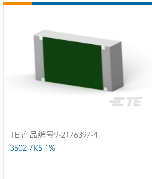
TE 产品编号9-2176397-4 3502 7K5 1%