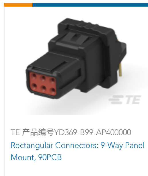
TE 产品编号YD369-B99-AP400000 Rectangular Connectors: 9-Way Panel Mount, 90PCB