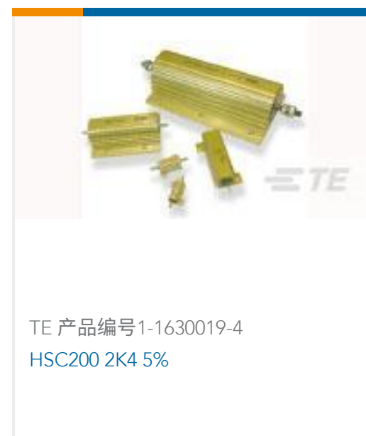
TE 产品编号1-1630019-4 HSC200 2K4 5%