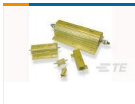
TE 产品编号1-1630019-4 HSC200 2K4 5%