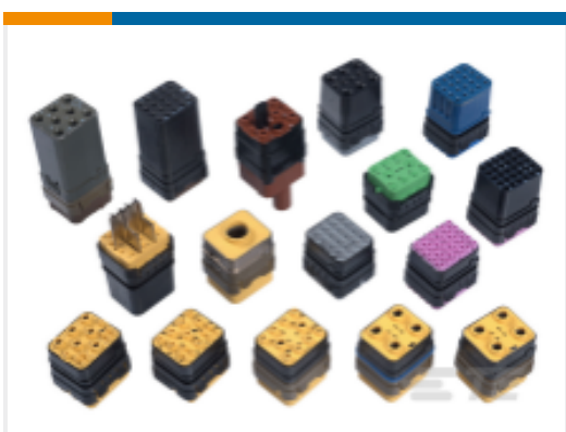
TE 产品编号ZPF000000000148762 DMC-M 99-04 AN (=33537-P0000)