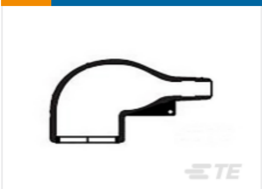
TE 产品编号EF9981-000 222K121-25L/225-0