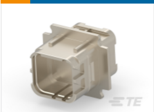
TE 产品编号ZPF000000000146309 Rectangular Connector Receptacle Extenders, Tool-less Assembly