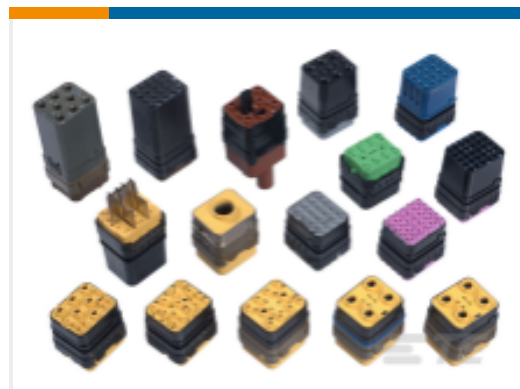
TE 产品编号ZPF000000000148762 DMC-M 99-04 AN (=33537-P0000)