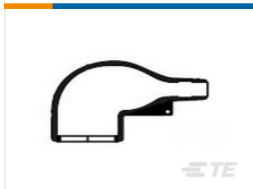
TE 产品编号EF9981-000 222K121-25L/225-0