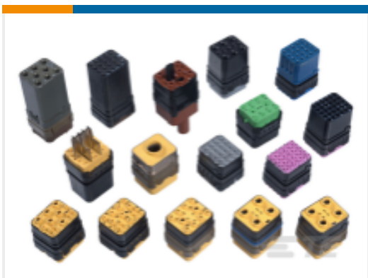
TE 产品编号ZPF000000000148762 DMC-M 99-04 AN (=33537-P0000)