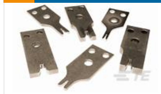
TE 产品编号8-571039-3 INSULATION CRIMPER