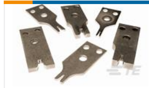
TE 产品编号2076539-3 INSULATION CRIMPER SPECIAL