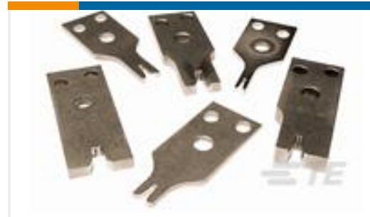
TE 产品编号2076539-2 INSULATION CRIMPER SPECIAL