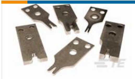
TE 产品编号2-2076295-9 WIRE CRIMPER