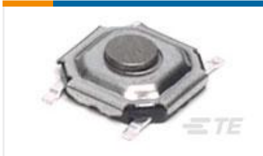
TE 产品编号8-1437565-0 FSMCTTR=TACTILE SWITCH T&R