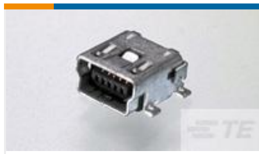
TE 产品编号1-1734035-1 MINI USB, TYPE B, R/A, SMT