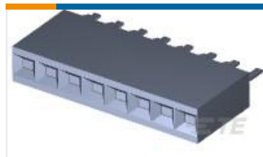
TE 产品编号5-534237-6 08 MODII VRT SR CE 100/115