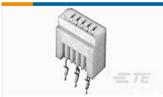
TE 产品编号84984-4 1mm FFC DIP V ASSY 4P NAT(TB)