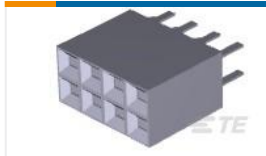
TE 产品编号5-534206-4 08 MODII VRT DR CE 100/115