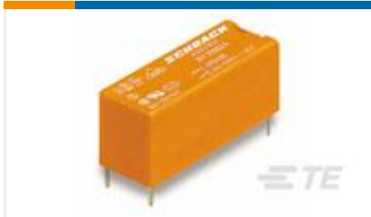
TE 产品编号4-1415400-1 RY631024