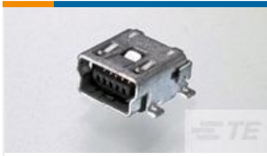
TE 产品编号1734035-4 MINI USB, TYPE B, R/A, SMT, MYLAR