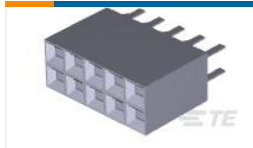
TE 产品编号534206-5 10 MODII VRT DR CE 100/115