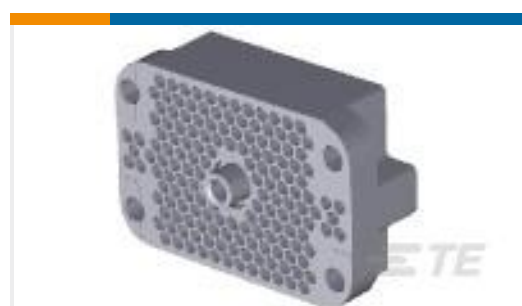
TE 产品编号202800-1 RECEPT ASSY,160 POSN,M SERIES