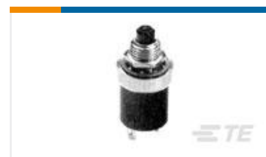
TE 产品编号1825516-3 MSP103C004