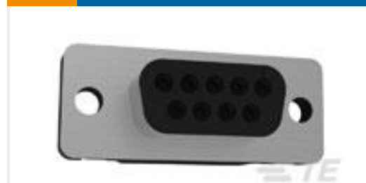
TE 产品编号1658612-4 09 POS HDF RCPT, MS, LEAD FREE