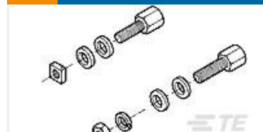
TE 产品编号212447-1 SCREW RTNR KIT,AMPLIMITE