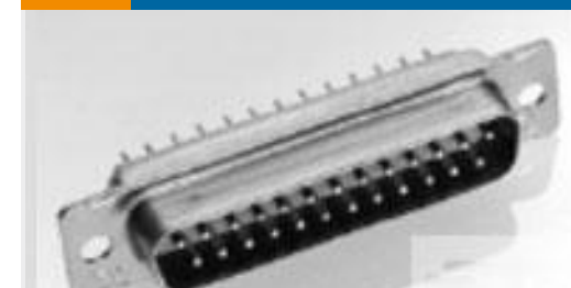
TE 产品编号207252-2 PLUG ASSY,SZ 1,AMPLIMITE