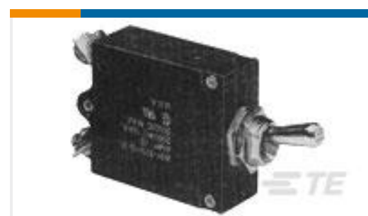
TE 产品编号3-1393247-4 W31-X2M1G-2=W23/W31