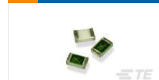
TE 产品编号1879208-8 CPF 0402 20R 0.1% 25PPM 1K RL