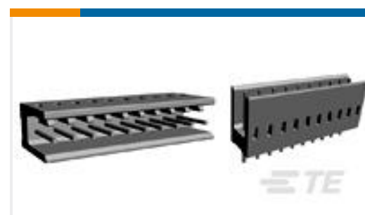
TE 产品编号826467-4 4P MOD II SHROUDED HEADER, ST