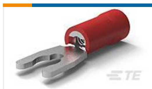
TE 产品编号52949 PG SPR SPD 22-16COMM 22-18MIL6