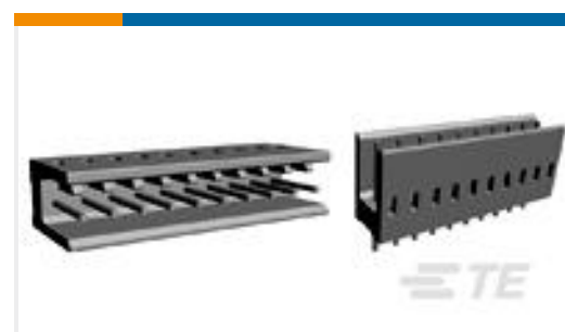
TE 产品编号826467-6 6P MOD II SHROUDED HEADER, ST