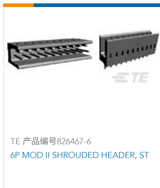
TE 产品编号826467-6 6P MOD II SHROUDED HEADER, ST