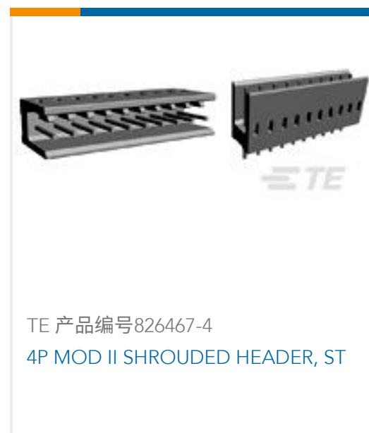
TE 产品编号826467-4 4P MOD II SHROUDED HEADER, ST