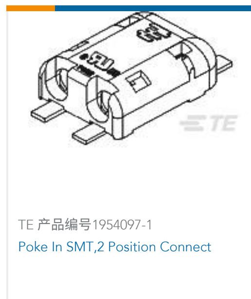
TE 产品编号1954097-1 Poke In SMT, 2 Position Connect