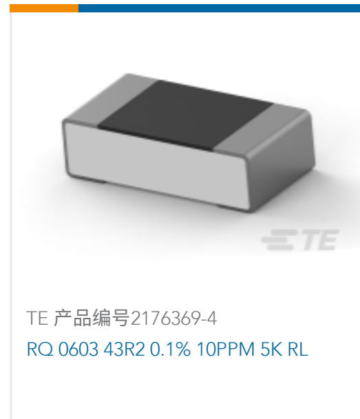
TE 产品编号2176369-4 RQ 0603 43R2 0.1% 10PPM 5K RL