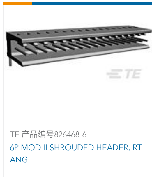
TE 产品编号826468-6 6P MOD II SHROUDED HEADER, RT ANG.