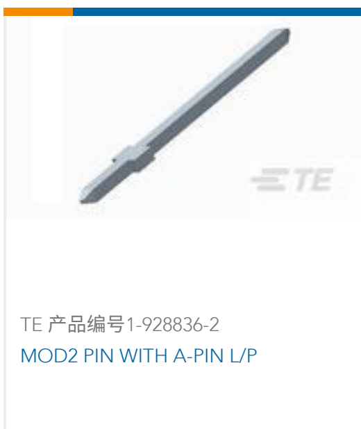
TE 产品编号1-928836-2 MOD2 PIN WITH A-PIN L/P