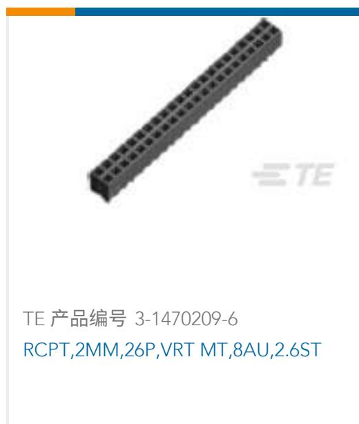
TE 产品编号 3-1470209-6 RCPT,2MM,26P,VRT MT,8AU,2.6ST