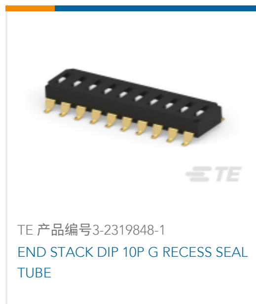
TE 产品编号3-2319848-1 END STACK DIP 10P G RECESS SEAL TUBE