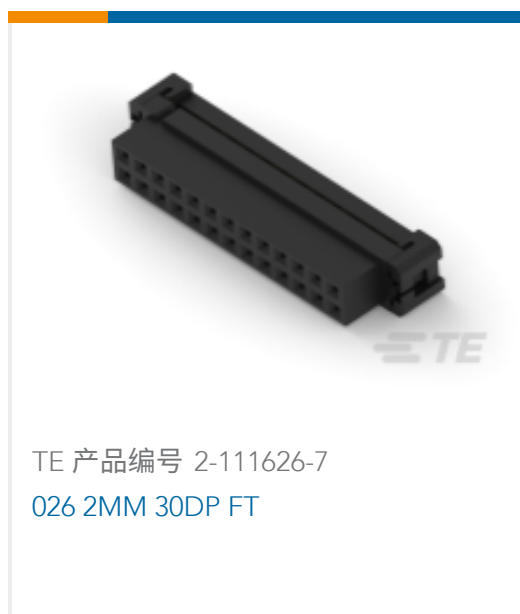
TE 产品编号 2-111626-7 026 2MM 30DP FT