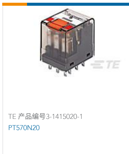
TE 产品编号3-1415020-1 PT570N20