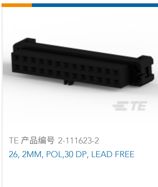
TE 产品编号 2-111623-2 26, 2MM, POL,30 DP, LEAD FREE