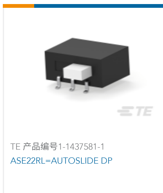
TE 产品编号1-1437581-1 ASE22RL=AUTOSLIDE DP