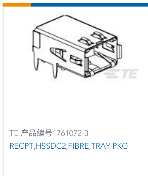
TE 产品编号1761072-3 RECPT,HSSDC2,FIBRE,TRAY PKG