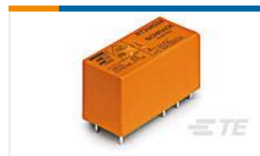
TE 产品编号9-1393239-5 RT314012