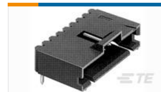
TE 产品编号5-103635-3 04 MTE HDR SRRA LTCH.100CL LF