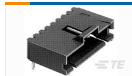
TE 产品编号5-103635-5 06 MTE HDR SRRA LTCH.100CL LF