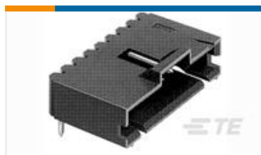
TE 产品编号5-103635-4 05 MTE HDR SRRA LTCH.100CL LF