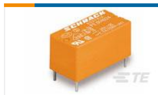
TE 产品编号1-1393219-0 PE014024