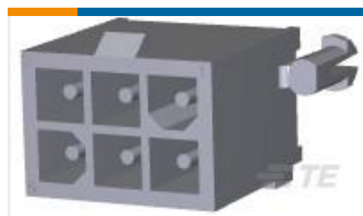
TE 产品编号1-770875-0 06P MINI UMNH HDR ASSY SN