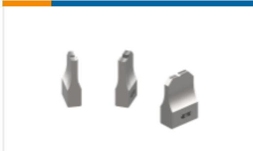
TE 产品编号1-238005-9 ANVIL