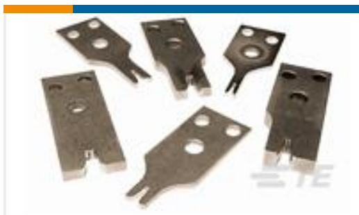
TE 产品编号733938-2 CRIMPER INS. "OVL"