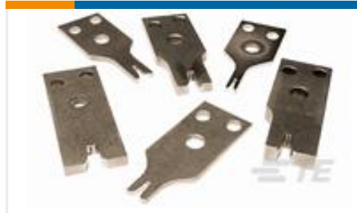
TE 产品编号4-657555-6 DRAHTCRIMPER