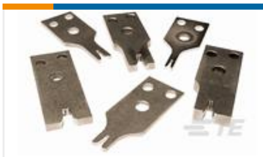
TE 产品编号4-456134-3 CRIMPER, INSULATION "F"(.180")