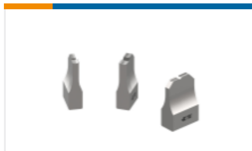
TE 产品编号879333-3 AMBOSS