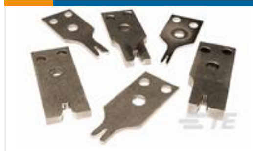
TE 产品编号5-1583690-2 CRIMPER, INSULATION "O"(.165)