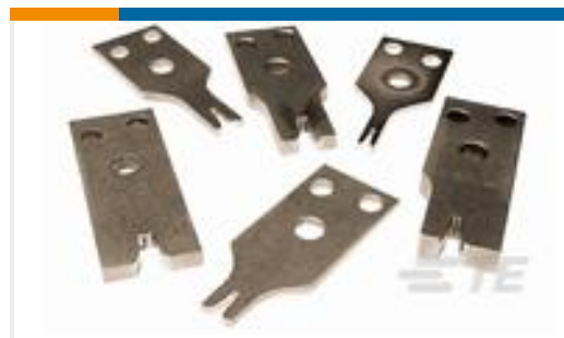
TE 产品编号2-456405-4 CRIMPER, WIRE .080 'F'