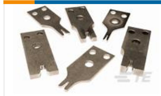
TE 产品编号5-568176-8 CRIMPER, WIRE (.051" 'F')