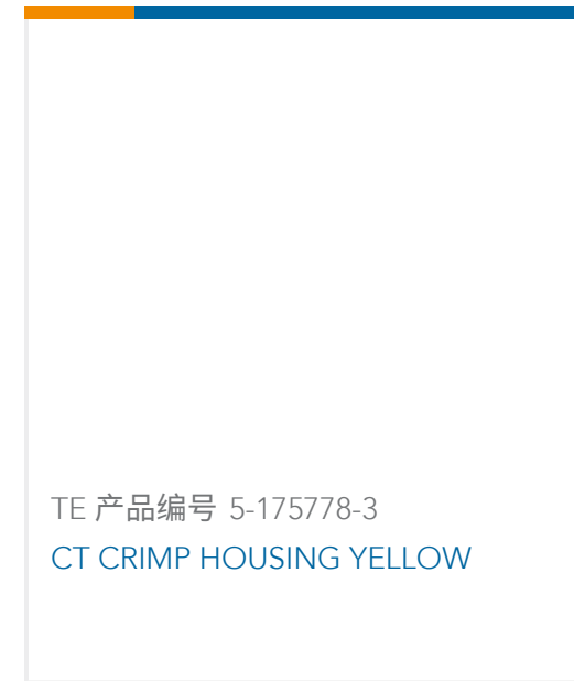
TE 产品编号 5-175778-3 CT CRIMP HOUSING YELLOW