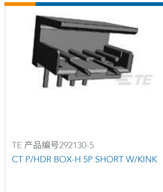
TE 产品编号292130-5 CT P/HDR BOX-H 5P SHORT W/KINK