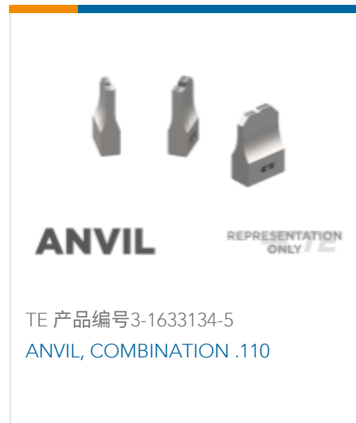
TE 产品编号3-1633134-5 ANVIL, COMBINATION .110