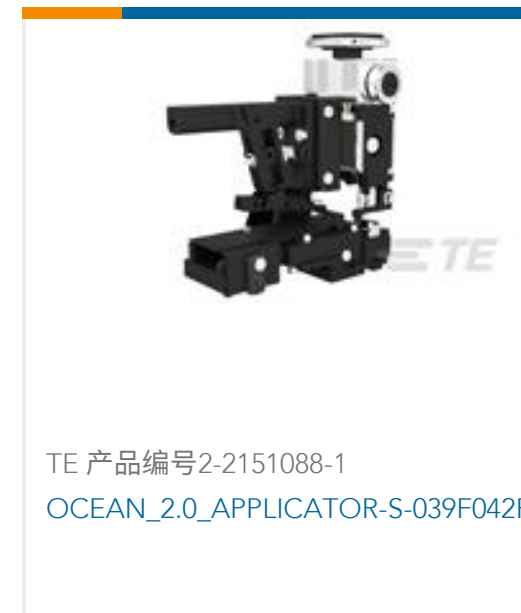
TE 产品编号2-2151088-1 OCEAN_2.0_APPLICATOR-S-039F042F