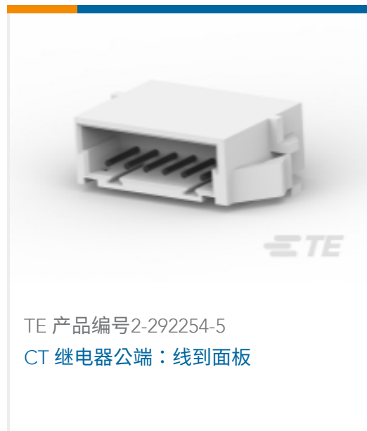
TE 产品编号2-292254-5 CT 继电器公端：线到面板