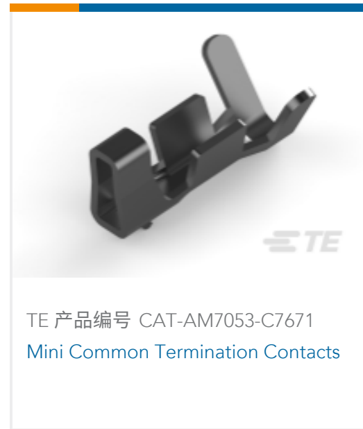
TE 产品编号 CAT-AM7053-C7671 Mini Common Termination Contacts