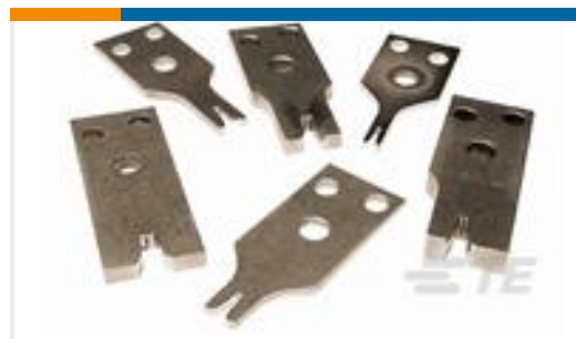
TE 产品编号6-1424909-6 CRIMPER, INSULATION "F"(.240")