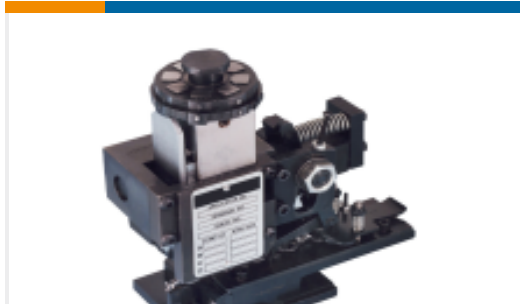
TE 产品编号680588-3 HDM 9HBAPR1405140OG