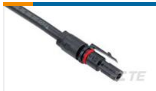
TE 产品编号1987559-1 PHOTOVOLTAIK CONNECTOR, 2.5 sqmm