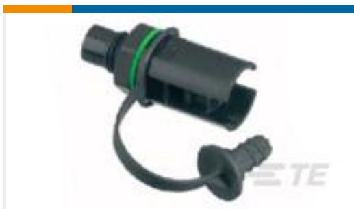
TE 产品编号1394739-1 STECKVERB.ABDECKUNG