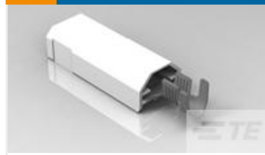
TE 产品编号521227-2 ULTRA-POD 250 ASSY TAB 12-10 AWG TPBR