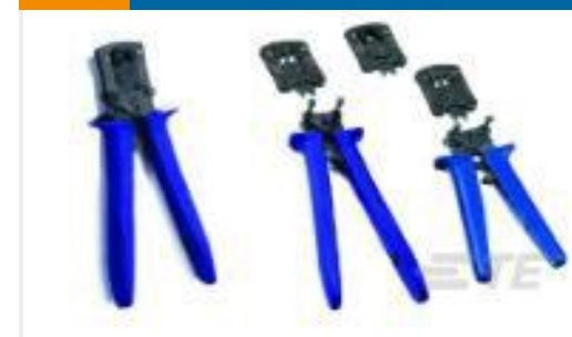
TE 产品编号1-1579004-2 CSV10 CRIMPING HANDTOOL SOLARLOK 4-6