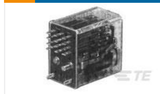
TE 产品编号1393766-3 R10-E1X2-S800=R10