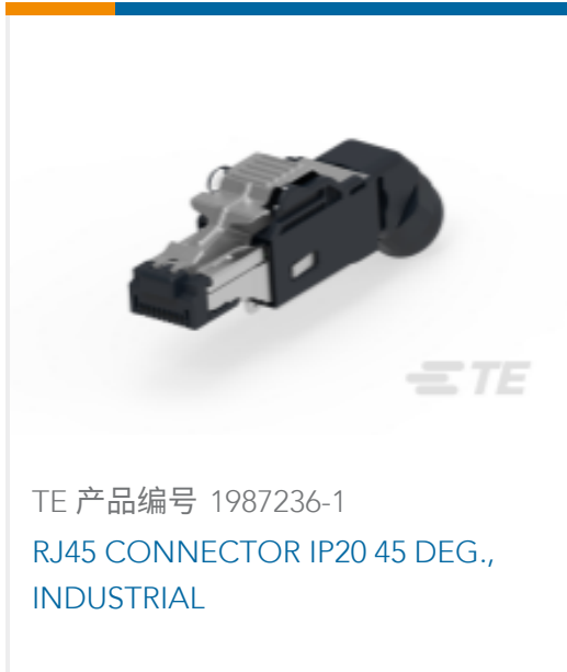
TE 产品编号 1987236-1 RJ45 CONNECTOR IP20 45 DEG., INDUSTRIAL