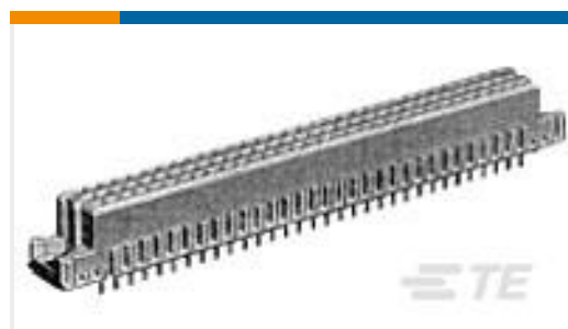
TE 产品编号5650956-5 ASSEMBLY,RECEPTACLE,EURO,TYPE