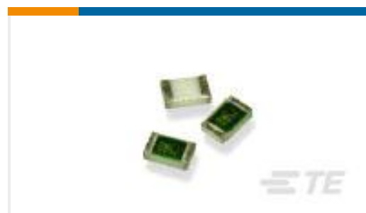
TE 产品编号8-1879335-2 CPF 0603 150R 1% 50PPM 1K RL