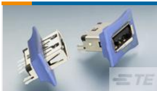
TE 产品编号1775690-2 Std USB Type A, VT, T/H, 2.5A