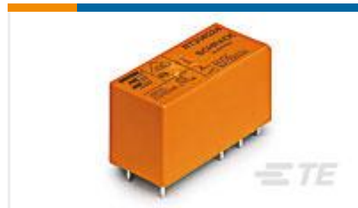
TE 产品编号1-1393240-1 RT315012