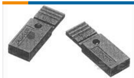
TE 产品编号2-881545-2 AMP SHUNT LOW PROFI