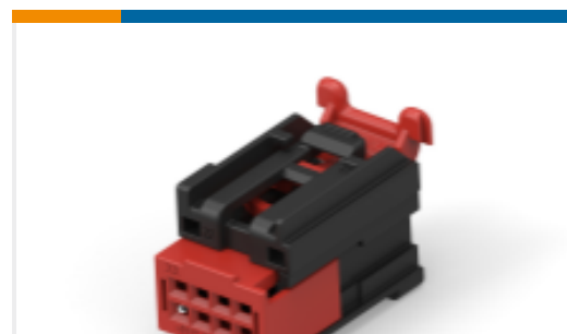
TE 产品编号1456987-1 2x4 Fem unsealed LP assy Key A