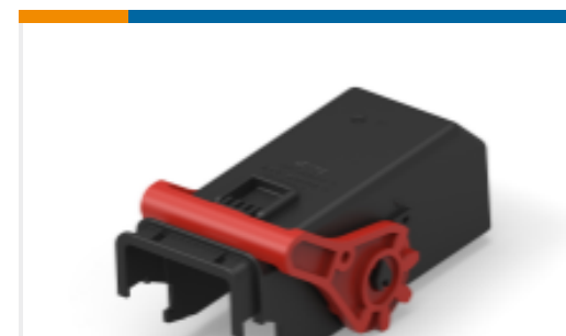
TE 产品编号2360002-1 REC CONN CVR ASSY,96POS,AMP MCP 2.8