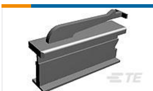
TE 产品编号1355528-2 MPQ 2.0 KONT-SICHNG8P