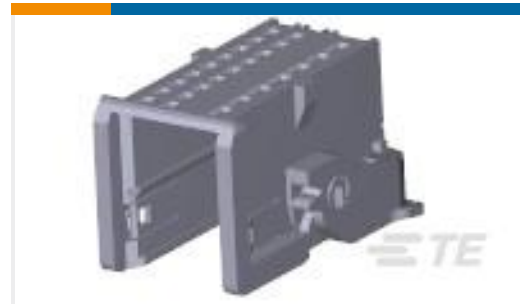
TE 产品编号1-1718484-4 CARRIER FOR RECEPTACLE INSERTS