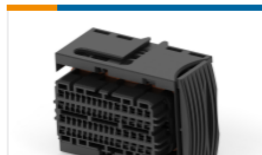
TE 产品编号2208277-3 60POS MQS REC SEALED