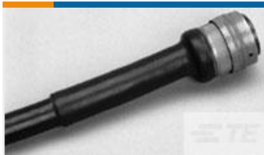
TE 产品编号1927574004 ATUM-6/2-2-SP