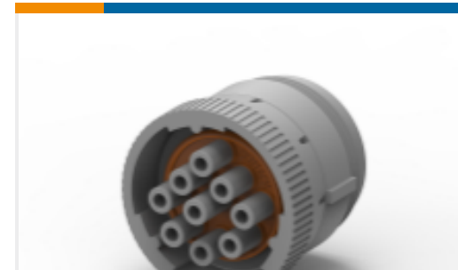
TE 产品编号HD16-9-96SE PLUG ASM