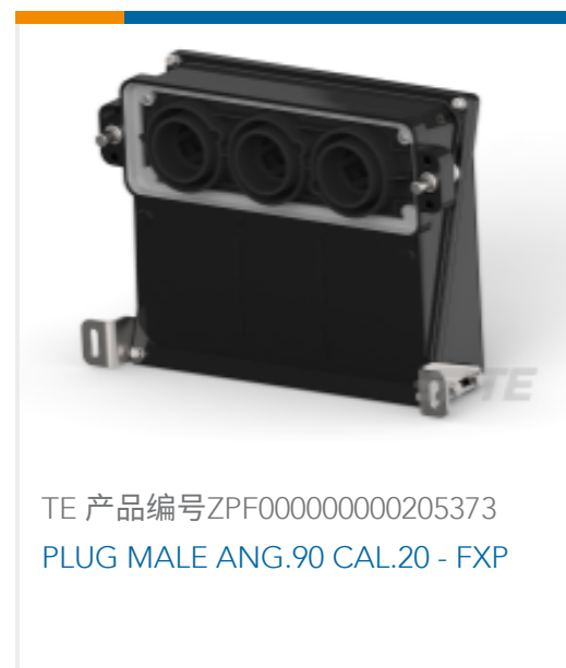
TE 产品编号ZPF000000000205373 PLUG MALE ANG.90 CAL.20 - FXP