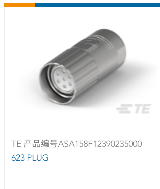
TE 产品编号ASA158F12390235000 623 PLUG