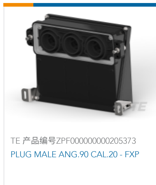
TE 产品编号ZPF000000000205373 PLUG MALE ANG.90 CAL.20 - FXP