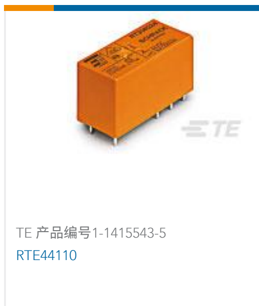
TE 产品编号1-1415543-5 RTE44110