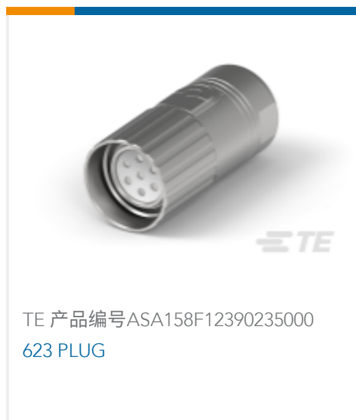
TE 产品编号ASA158F12390235000 623 PLUG