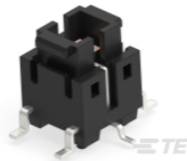
TE 产品编号 5-2213819-3 6X6 ILL TACT SMT 520GF LI SOFT ORANGE