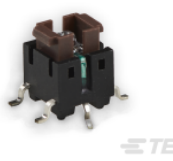
TE 产品编号 2-2213819-9 6X6 ILL TACT SMT 160GF HI SOFT ORANGE