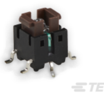
TE 产品编号 2-2213819-3 6X6 ILL TACT SMT 160GF LI RED