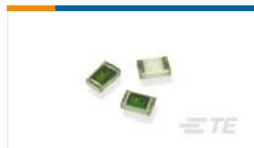
TE 产品编号1676221-2 RN 0805 1K0 0.1% 10PPM 1KRL