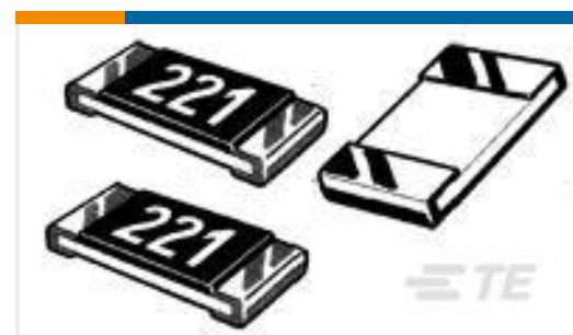
TE 产品编号6-2176070-8 3521 6K2 1% 2W