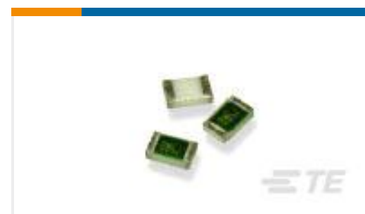
TE 产品编号8-1614884-4 CPF 0805 10K 0.1% 25PPM 1K RL