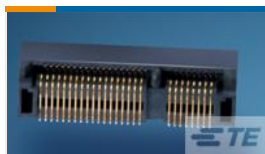
TE 产品编号1759503-1 mini PCI-E 8H Type I PKG G/F