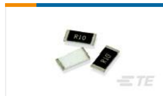
TE 产品编号1-2176055-5 RLP73M 2B R039 1% 1K RL