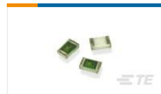
TE 产品编号1676219-2 RN 0805 1K05 0.1% 10PPM 1KRL