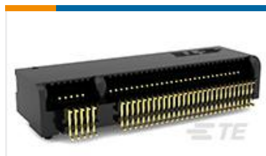
TE 产品编号2199230-8 M.2 0.5PITCH 4.2H KEY A 15U" AU