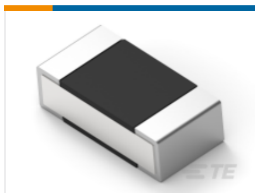
TE 产品编号7-2176305-3 RP 1E 0.1W 604R 0.1% 25PPM 5K RL