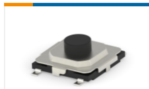
TE 产品编号2337238-3 TACT MINI GW 5.2X5.2X2 160GF