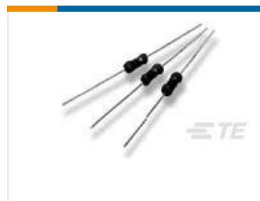
TE 产品编号1-1879353-9 RR02 5% 24K AMMO