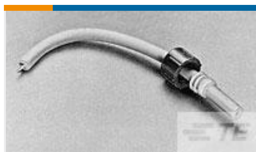
TE 产品编号1-830611-0 LGH 1/2 SNGL MLD END