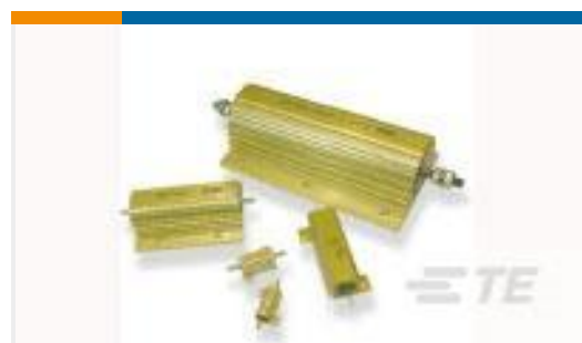
TE 产品编号9-1625971-5 HSA25 R01 10%