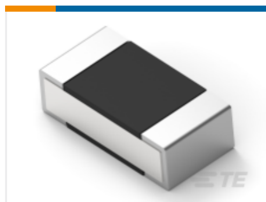
TE 产品编号3-2176307-2 RP 1E 0.1W 26K1 0.1% 25PPM 5K RL