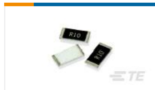
TE 产品编号2-2176057-9 RLP73K 3A R15 1% 1K RL