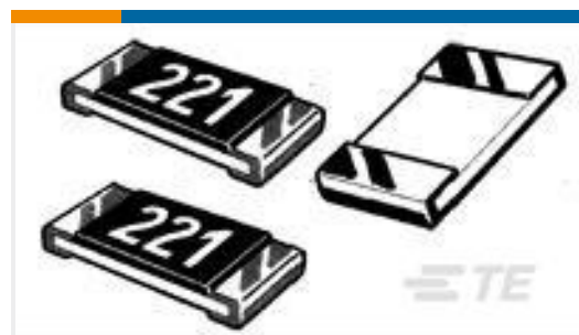
TE 产品编号5-2176070-2 3521 1K3 1% 2W