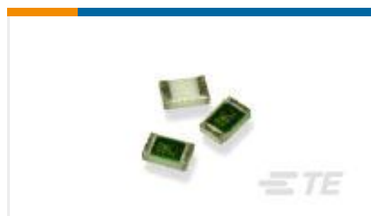
TE 产品编号9-1879214-0 CPF 0402 3K16 0.1% 25PPM 1K RL