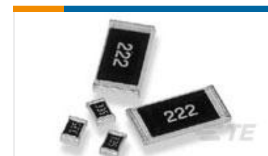
TE 产品编号1-1879501-1 CRGH2512 5% 2R7 2W