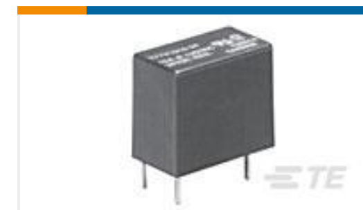
TE 产品编号1-1393194-3 T77S1D3-05