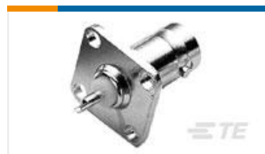
TE 产品编号1-1337446-0 BNC Pnl Skt 50Ohm Silver Pltd