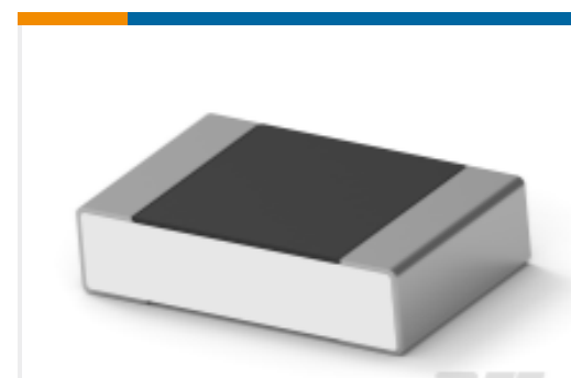
TE 产品编号9-2176373-7 RQ 0805 100R 0.1% 10PPM 1K RL