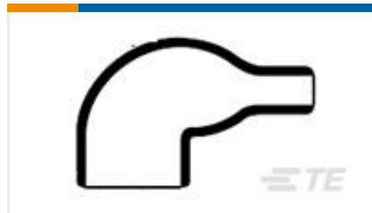
TE 产品编号071855-000 222A142-25/225-0