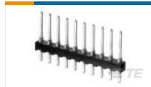
TE 产品编号87220-4 04 MODII HDR SRST UNSHRD .100