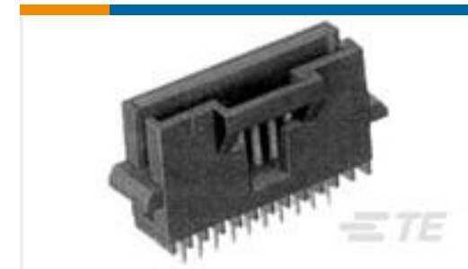
TE 产品编号6-104071-6 36 SYSTEM 50 HDR SRST SHRD SN