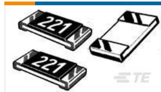
TE 产品编号7-2176070-3 3521 10K 1% 2W