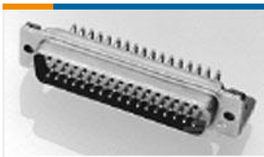
TE 产品编号1218408-5 AMPLIMITE, ASY, RCPT, RTANG, 109,5