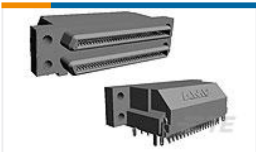
TE 产品编号5787962-2 .8MM CHAMP STACK RCPT ASSY