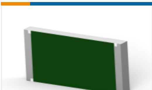
TE 产品编号4-2176403-6 3550 75R 1%