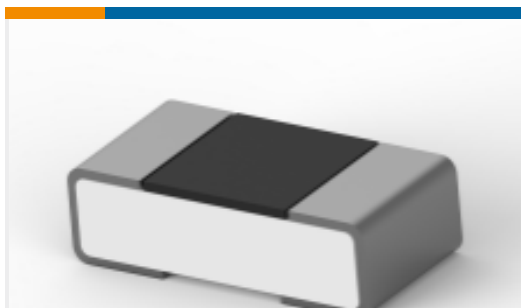
TE 产品编号2-2176362-7 RQ 0402 75R 0.1% 10PPM 5K RL