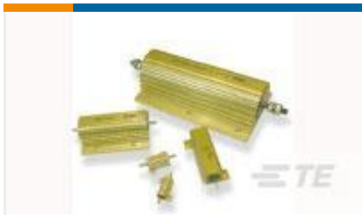
TE 产品编号2-1630019-6 HSC200 6R8 5%