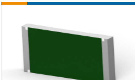
TE 产品编号4-2176403-1 3550 47R 1%