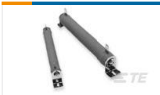
TE 产品编号1879450-6 TE 500W 2R7 5% Bracket