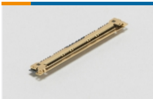
LVDS 连接器 (LCEDI)(6)