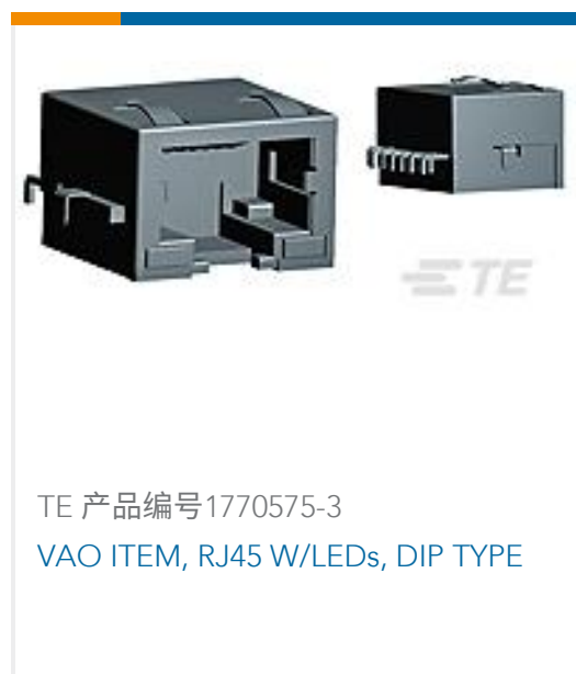
TE 产品编号1770575-3 VAO ITEM, RJ45 W/LEDs, DIP TYPE