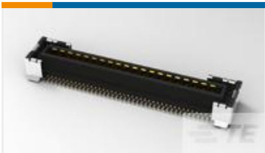
TE 产品编号2023308-3 (LCEDI) SR interface Rec conn 40pos