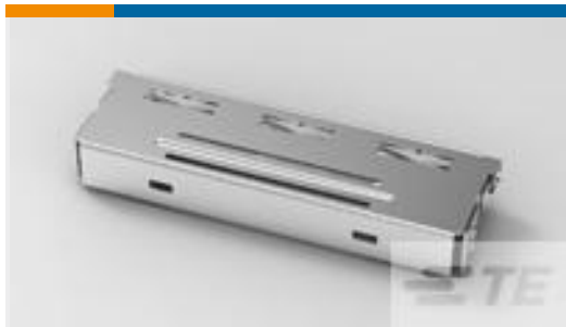
TE 产品编号2023317-1 (LCEDI) SR serie plug upper shell 40pos