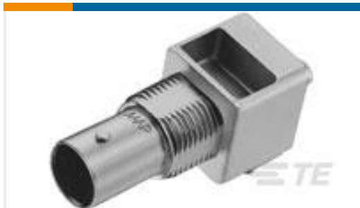
TE 产品编号6274084-1 JACK ASSEMBLY, BNC