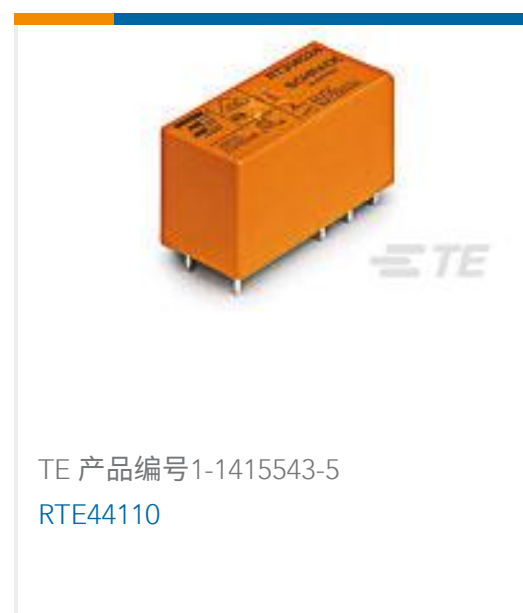
TE 产品编号1-1415543-5 RTE44110