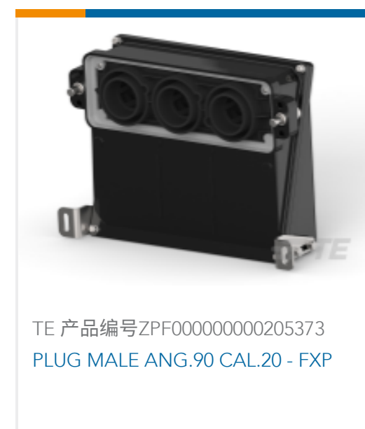
TE 产品编号ZPF00000000205373 PLUG MALE ANG.90 CAL.20 - FXP