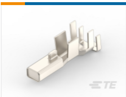
TE 产品编号 CAT-P87074-R2435 Receptacle Contact — POWER TRIPLE LOCK