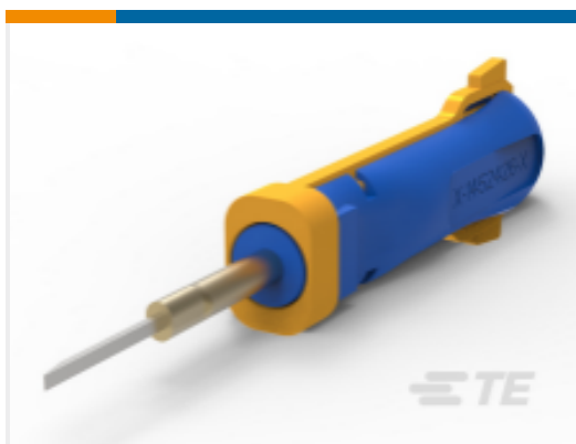
TE 产品编号 1452426-1 EXTRACTION TOOL