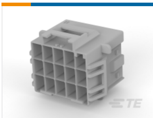
TE 产品编号 5-1971875-7 PTL 3X5 CAP PANEL MT HITEMP KEY A LGR