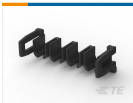
TE 产品编号 CAT-P87074-T669 Locking Plate, POWER TRIPLE LOCK, TPA