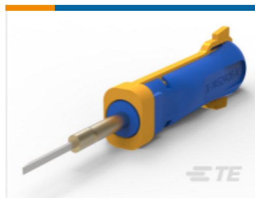
TE 产品编号 1452426-1 EXTRACTION TOOL