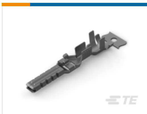
TE 产品编号 CAT-P87074-T111 Tab Contact — POWER TRIPLE LOCK