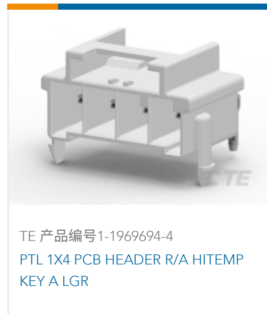
TE 产品编号1-1969694-4 PTL 1X4 PCB HEADER R/A HITEMP KEY A LGR