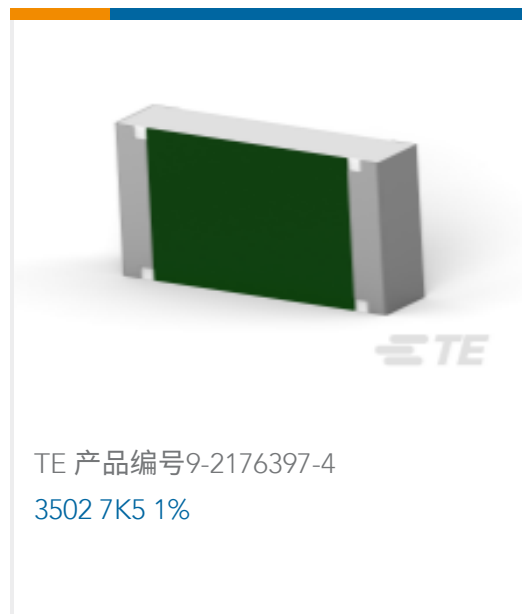
TE 产品编号9-2176397-4 3502 7K5 1%