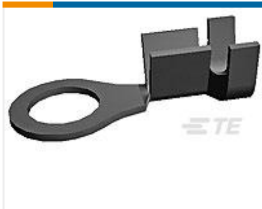
TE 产品编号160467-2 RT IS 1.0-2.5MM2 0.315 X .708 TPBR