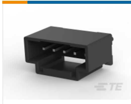
TE 产品编号5-1971798-5 NEW GI CONN2.5 HDR ASMBLY 5P BLK D1.0