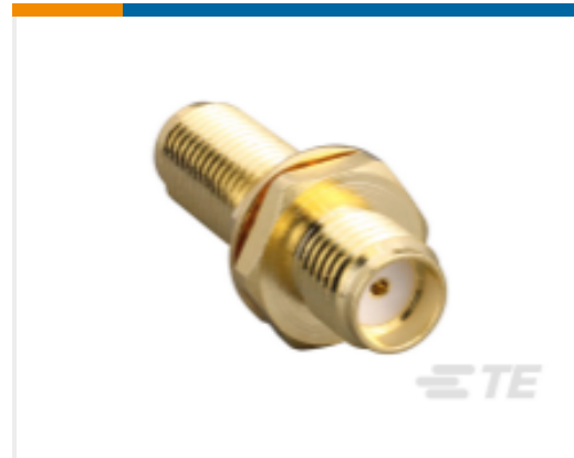
TE 产品编号ADP-SMAF-SMAF-B-G SMA Jack to SMA Jack Bulkhead