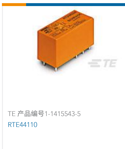
TE 产品编号1-1415543-5 RTE44110