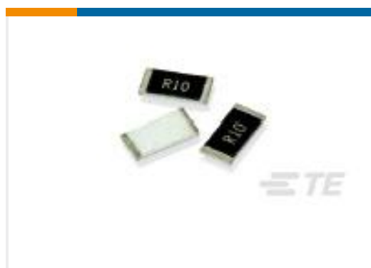
TE 产品编号2-1879461-5 RL73H 2A R13 1% 1K RL