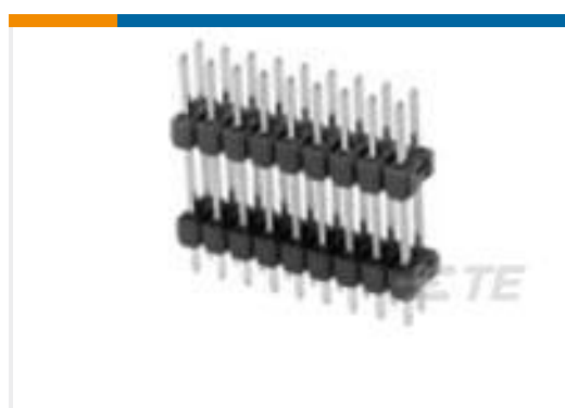
TE 产品编号5-146496-2 04 MODII HDR DRST UNSHRD STKG