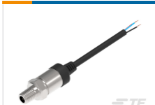
TE 产品编号20014203-12 PRESS XDCR M325M-000005-250PG