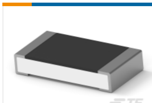
TE 产品编号1-2176391-0 RQ 1206 15K4 0.1% 10PPM 5K RL