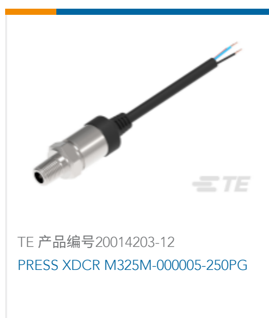
TE 产品编号20014203-12 PRESS XDCR M325M-000005-250PG