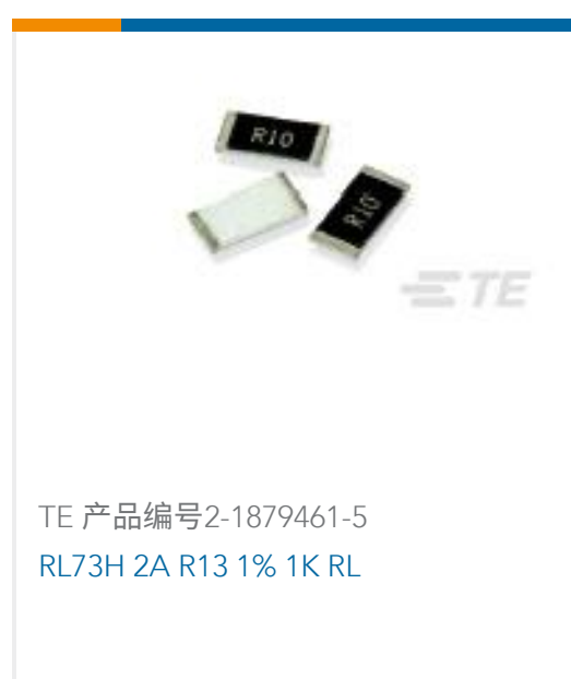
TE 产品编号2-1879461-5 RL73H 2A R13 1% 1K RL