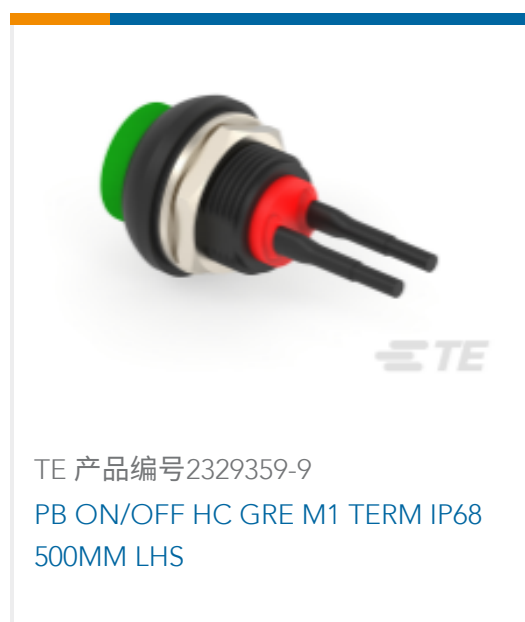
TE 产品编号2329359-9 PB ON/OFF HC GRE M1 TERM IP68 500MM LHS