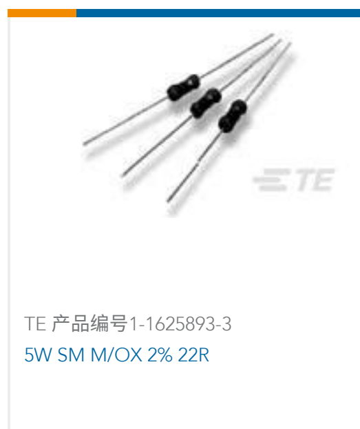
TE 产品编号1-1625893-3 5W SM M/OX 2% 22R