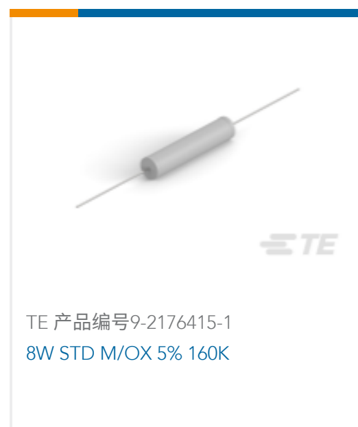
TE 产品编号9-2176415-1 8W STD M/OX 5% 160K